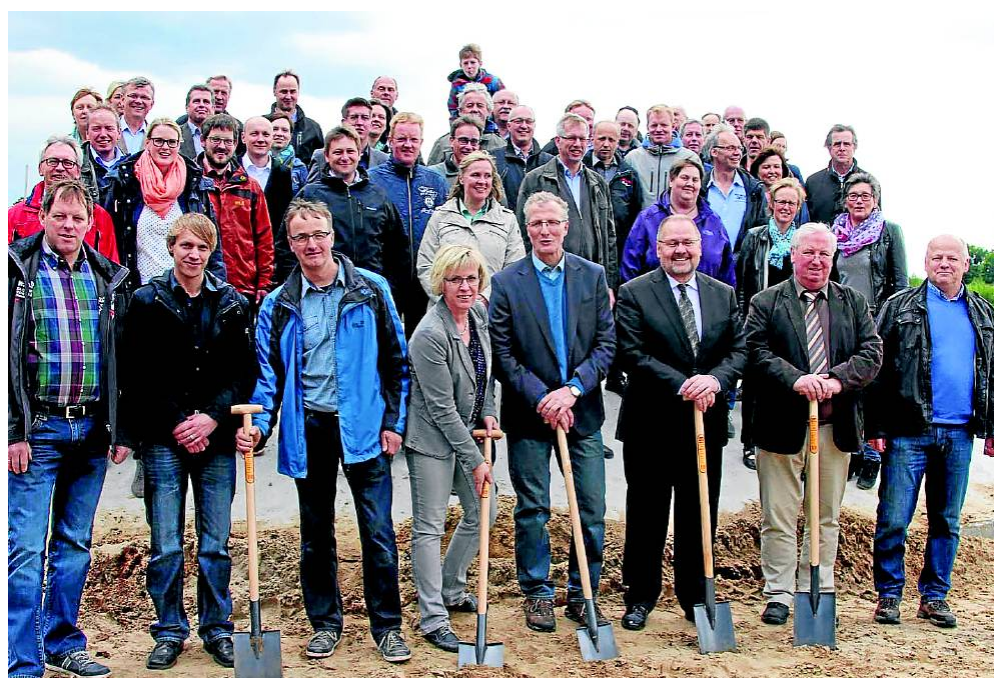
Am 1. Spatenstich nahmen Mitglieder der beiden Bürgerwind-Gesellschaften, Vertreter der Gemeinden sowie der beteiligten Firmen und Banken teil.

genschaft beabsichtigt, um vielen die Möglichkeit zu eröffnen, Kommanditist bzw. Mitunternehmer des Windparks zu werden. ■ Informationen über den Projektfortschritt, die anstehende Bürgerversammlung zu weiteren Details des Vorhabens und Beteiligungsmöglichkeiten sind aus der MV und im Internet zu erhalten: buergerwind-wettringen.de