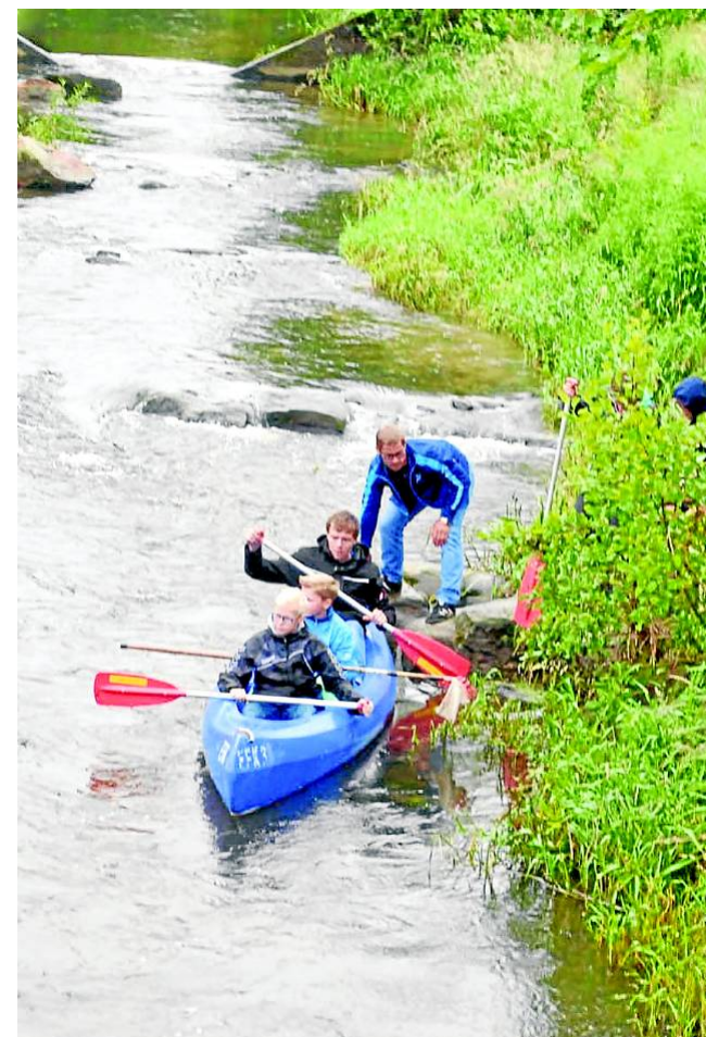
Ententreiber werden wieder dafür sorgen, dass sich keine „müde“ Ente im Ufergestrüpp dem Rennen entzieht.

Vermutlich wird die Siegerente gegen 16 Uhr das Ziel am Heimathaus erreichen. Wie im Vorjahr werden dort die Rentenenbesitzer voller Spannung warten. Damit ihnen die Zeit nicht zu lang wird, werden Getränke und Verpflegung angeboten. Besonders freuen wird sich Alina Petsch, denn sie erhält eine Spende von 500 Euro für ihren Therapiehund (MV berichtete).